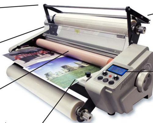
Table d'introduction équipée de guides

Adaptateurs de mandrin pour 76mm et 25 mm